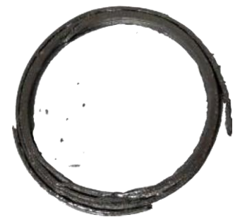
Joint graphite libérant des particules en se désagrégeant

D'autre part, il est impératif que seuls les matériaux conformes à la FDA soient en contact avec le principe actif, avec des exigences de propreté strictes pour les vannes sur les lignes de fabrication des API*.